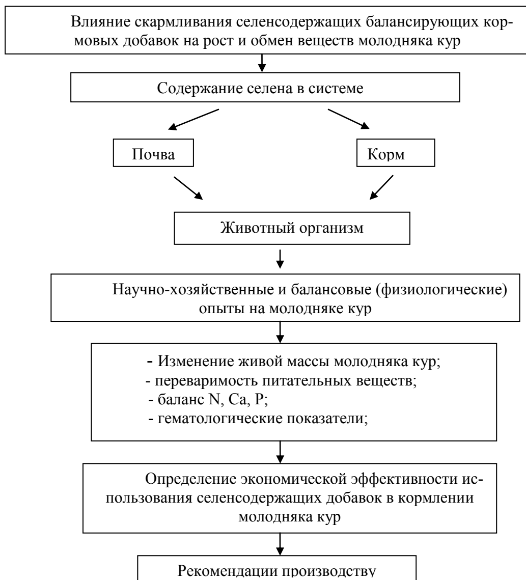
Рис. 1 – Общая схема проведения научных исследований

Для решения поставленных задач в условиях Муниципального Унитарного Предприятия (МУП) «Николаевская птицефабрика» Бурейского района Амурской области в 2007 - 2009 гг. было проведено два научно-хозяйственных опыта на молодняке кур кросса Хайкесе - Белый в соответствии со схемами проведения исследований (рис. 1, табл. 1,2). Для эксперимента подбирали молодняк кур по методу групп – аналогов с учетом возраста, пола, живой массы, среднесуточного прироста и физиологического состояния.